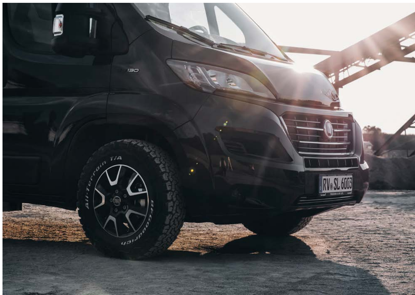
16" ALUMIINIVANTEET (KUVAN RENKAAT EIVÄT VASTAA AUTON MUKANA TOIMITETTAVIA VAKIORENKAITA)

CLIFF XV:n selkeälinjaisessa tyyliässä on samaan aikaan kulmikkuutta ja sulavuutta. Urheilullista vaikutelmaa korostavat laadukkaat designelementit ja kokonaisuuteen sulautuvat tyylikkääät lisävarusteet. Pehmeän puolensa Cliff XV näyttää muun muassa tyylikkääällä Alcantara -istuiverhoilulla, joka on aitoa nahkaa.