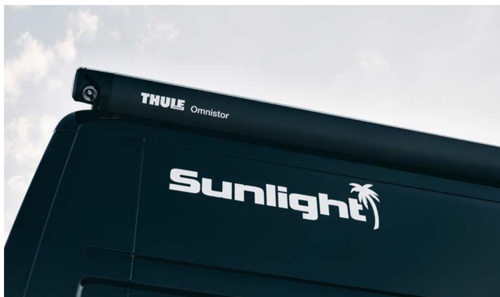
MUSTA MARKIISIN KOTELO